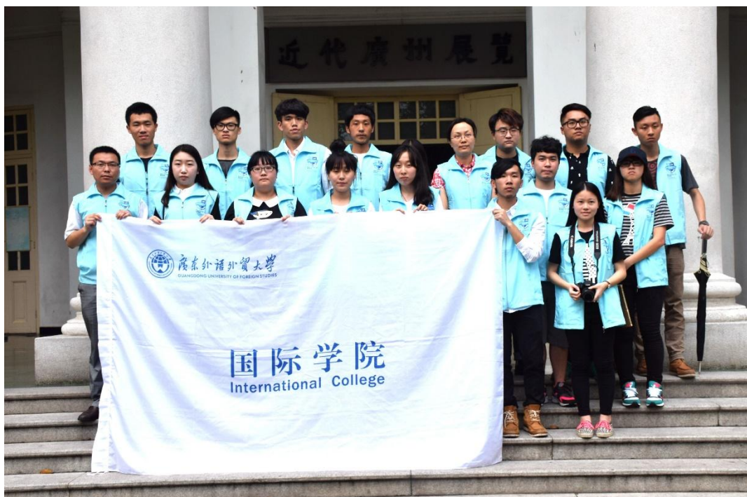
广东革命历史博物馆门前合影留念