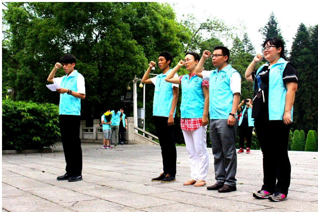
党员重温入党誓词