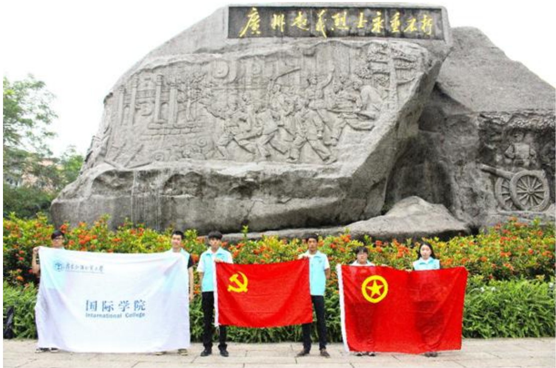
学生党员、团学干部举起院旗、党旗与团旗向烈士致敬