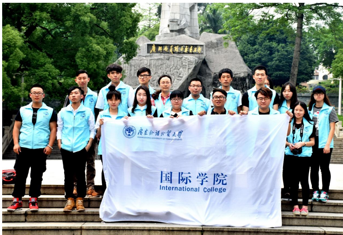
纪念碑前合照留念

砌，两侧建花圃遍种红花，两旁的山坡上遍植青松翠柏，终年红花不绝，四季长青，西南有广东历史博物馆。纪念性建筑物和自然环境浑然一体，在一片青山绿水之中点缀以碑亭桥榭，在遍地红花的坡地中交织着石道幽径。